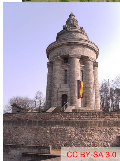
CC BY-SA 3.0