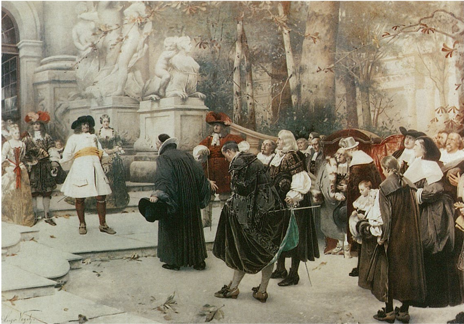
Hugo Vogel (1885)