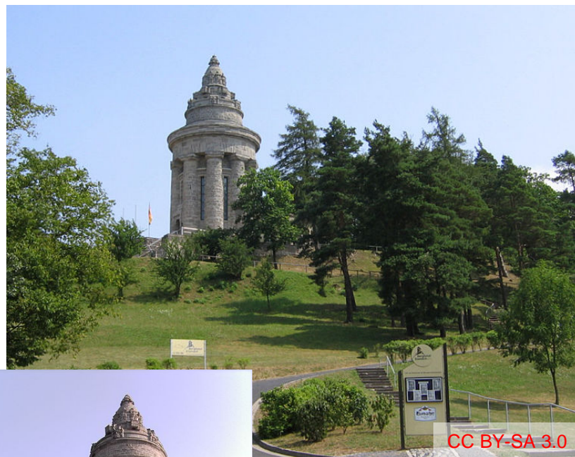
CC BY-SA 3.0