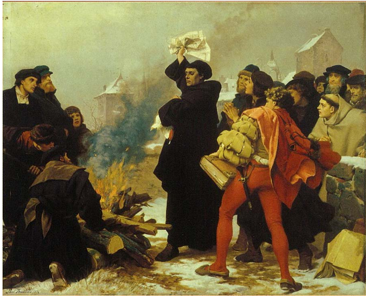
Paul Thumann (1872)