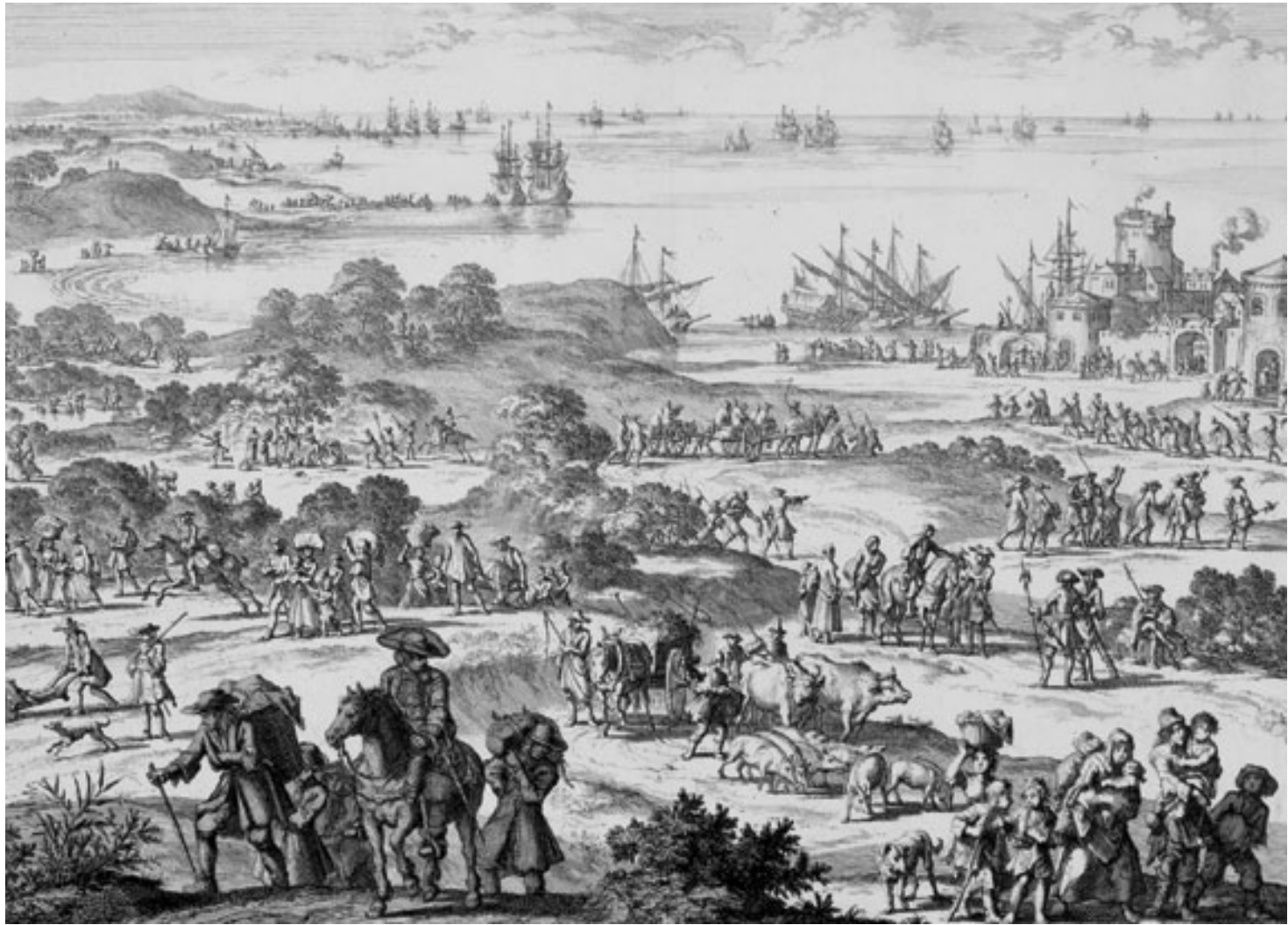
Jan Luyken (1696)