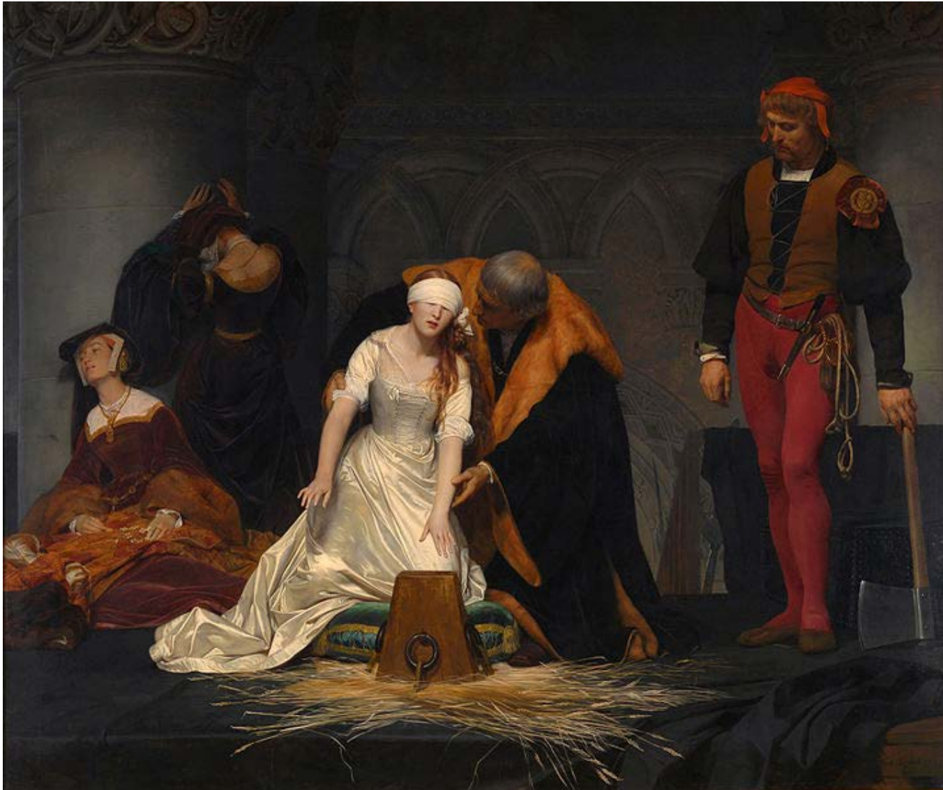
Paul Delaroche (1833)