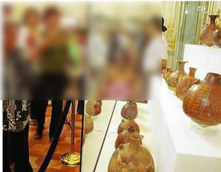
マチュピチュ遺跡の出土品を見る人々＝リマ、平山写す