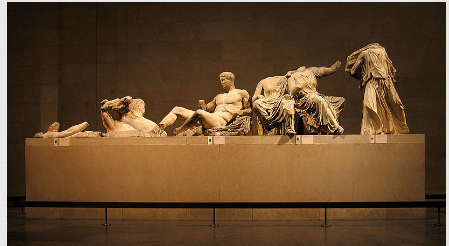
Image by Andrew Dunn,, from Wikimedia Commons (2014/04/23) http://commons.wikimedia.org/wiki/File:Elgin_Marbles_east_pediment.jpg CC BY-SA 2.0